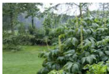
Bomen en vaste planten